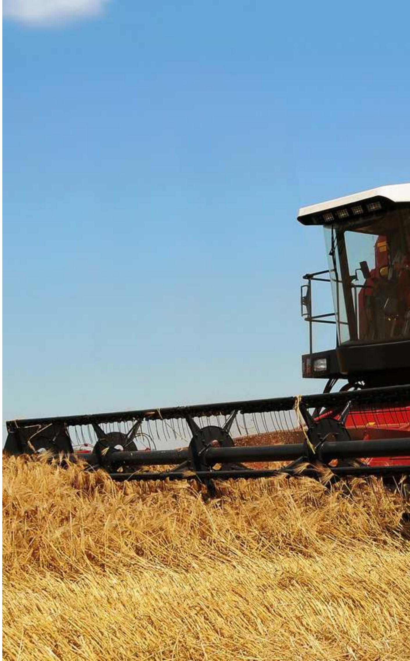
Зерноуборочный комбайн «ПАЛЕССЕ Gs12»